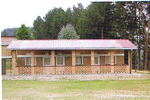
L'ambulatorio odontoiatrico del Centre de Santé di Rugege